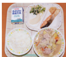
夜間部は給食があります